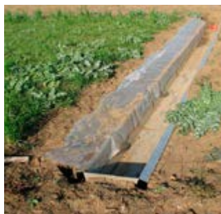
Αγροτεμάχιο με τη χρήση ζώνης