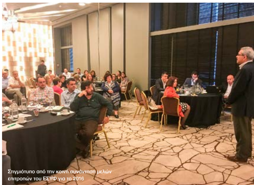
Σημείωμα από την κοινή συνάντηση μελών επιτροπών του ΕΣΥΦ για το 2016

Η επιτροπή ασχολήθηκε με θέματα σχετικά με την εφαρμογή της νέα SEVESO III, την τροποποίηση της νομοθεσίας για τις θαλάσσιες μεταφορές επικίνδυνων φορτίων όπου εντοπίστηκαν λάθη σε συγκεκριμένα άρθρα και τέλος με την παρακολούθηση του πιλοτικού προγράμματος για την ορθή διαχείριση κενών πλαστικών φιαλών φ.π.