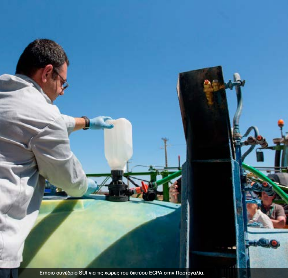
Ετήσιο συνέδριο SUI για τις χώρες του δικτύου ECPA στην Πορτογαλία.