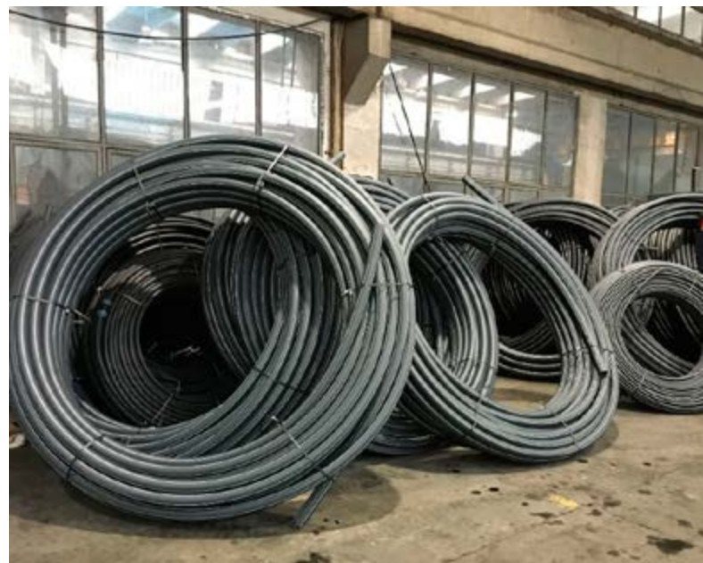
Πλαστικοί αγωγοί HDPE από ανακυκλωμένα κενά πλαστικά φ.π.

Η 2η συνάντηση των χωρών που εφαρμόζουν πιλοτικά προγράμματα ανακύκλωσης κενών πλαστικών φιαλών φ.π. πραγματοποιήθηκε με στόχο την ανταλλαγή εμπειριών και αποτελεσμάτων με στόχο τη βελτίωσή του. Πέραν εκπροσώπων από την Ελλάδα συμμετείχαν και από τις εξής χώρες: Βουλγαρία, Κύπρος, Λιθουανία, Ρουμανία και Σερβία.