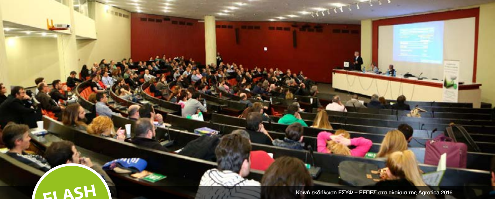
Κοινή εκδήλωση ΕΣΥΦ – ΕΕΠΕΣ στα πλαίσια της Agrotica 2016