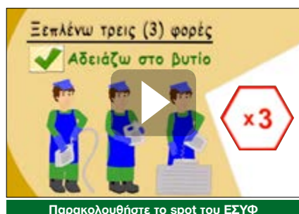
Παρακολουθήστε το spot του ΕΣΥΦ

Από φέτος, μία ειδική ομάδα εργασίας με εκπροσώπους από τους συνεργαζόμενους φορείς (ΕΣΥΦ, ΕΟΑΝ, ΕΕΑΑ, ΥπΑΑΤ) θα επιβλέπει την πορεία του προγράμματος και θα προτείνει διορθωτικές ενέργειες.