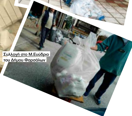
Συλλογή στο Μ.Ευύδριο του Δήμου Φαρσάλων