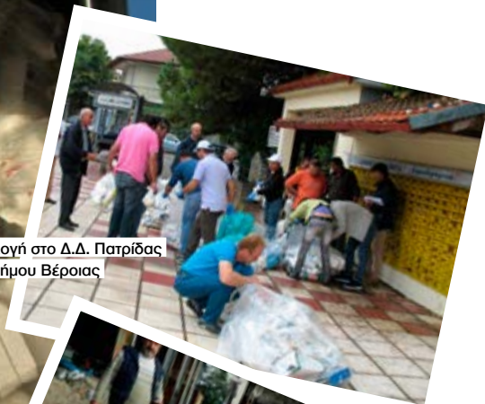
Συλλογή στο Δ.Δ. Πατρίδας του Δήμου Βέροιας