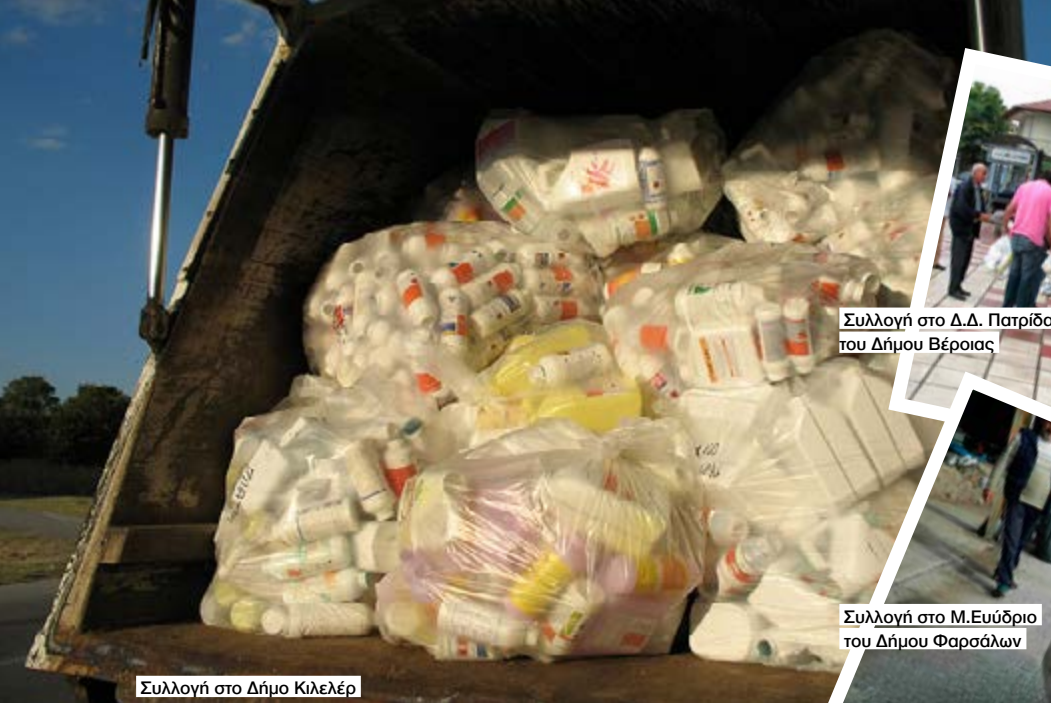
Συλλογή στο Δήμο Κιλελέρ