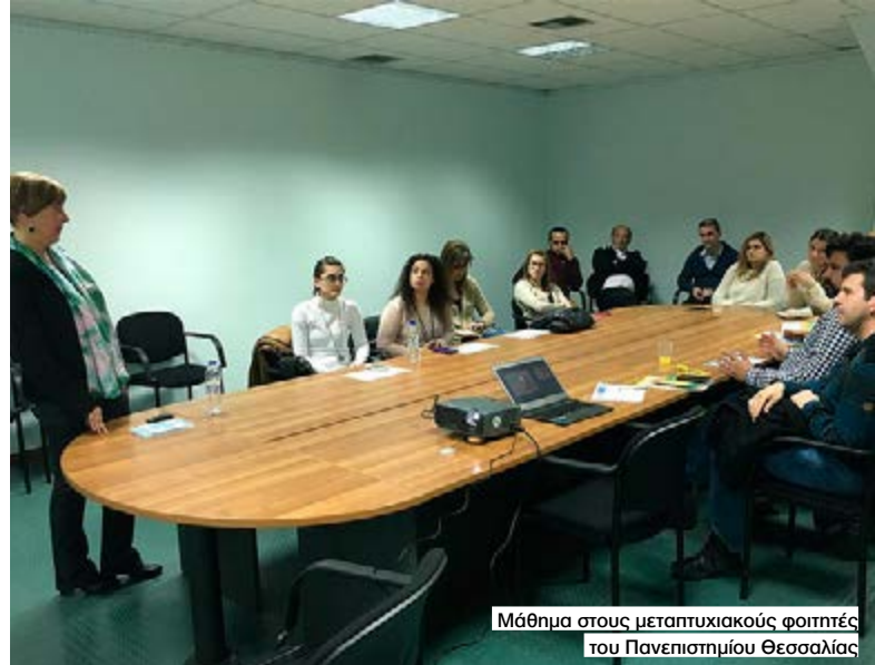
Μάθημα στους μεταπτυχιακούς φοιτητές του Πανεπιστημίου Θεσσαλίας