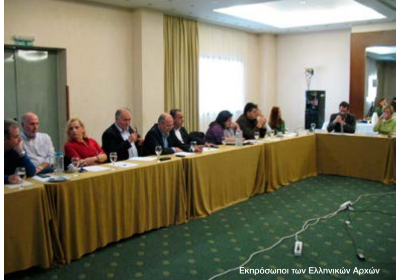
Εκπρόσωποι των Ελληνικών Αρχών