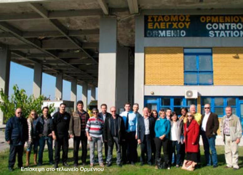
Επίσκεψη στο τελωνείο Ορμένιου