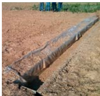
Αγροτεμάχιο χωρίς χρήση ζώνης (εμφανής διάβρωση)

Ο ΕΣΥΦ πραγματοποίησε επίσης 3ωρο μάθημα στους μεταπτυχιακούς φοιτητές του Πανεπιστημίου Θεσσαλίας του προαναφερθέντος Τμήματος, σε σχέση με το ρόλο της βιομηχανίας φ.π. και τα προγράμματα που εφαρμόζει στην Ελλάδα δίνοντας ιδιαίτερο βάρος στο TOPPS που υλοποιεί από κοινού με το Πανεπιστήμιο.