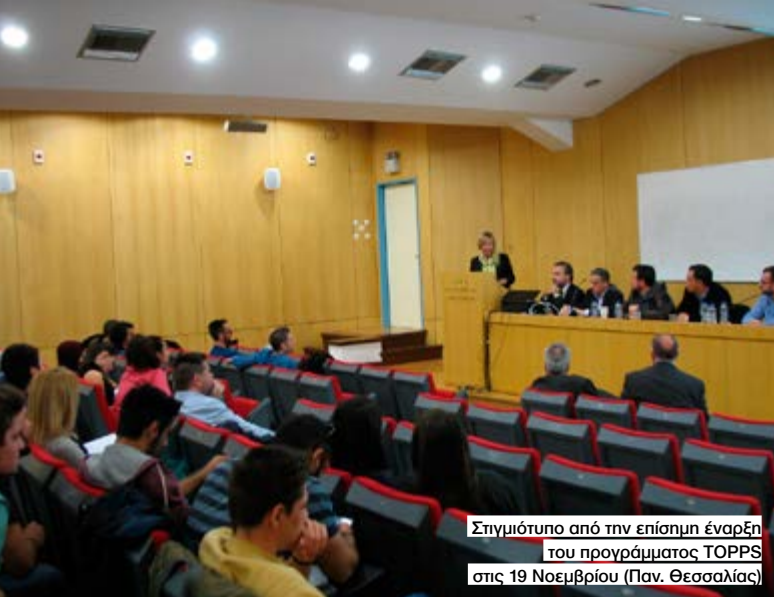
Στημιότυπο από την επίσημη έναρξη του προγράμματος TOPPS στις 19 Νοεμβρίου (Παν. Θεσσαλίας)